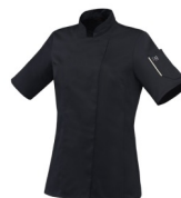
Noir - Ecreu