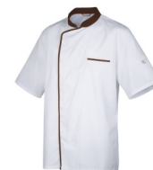
Blanc - Moka