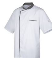
Blanc - Anthracite