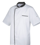
Blanc - Noir